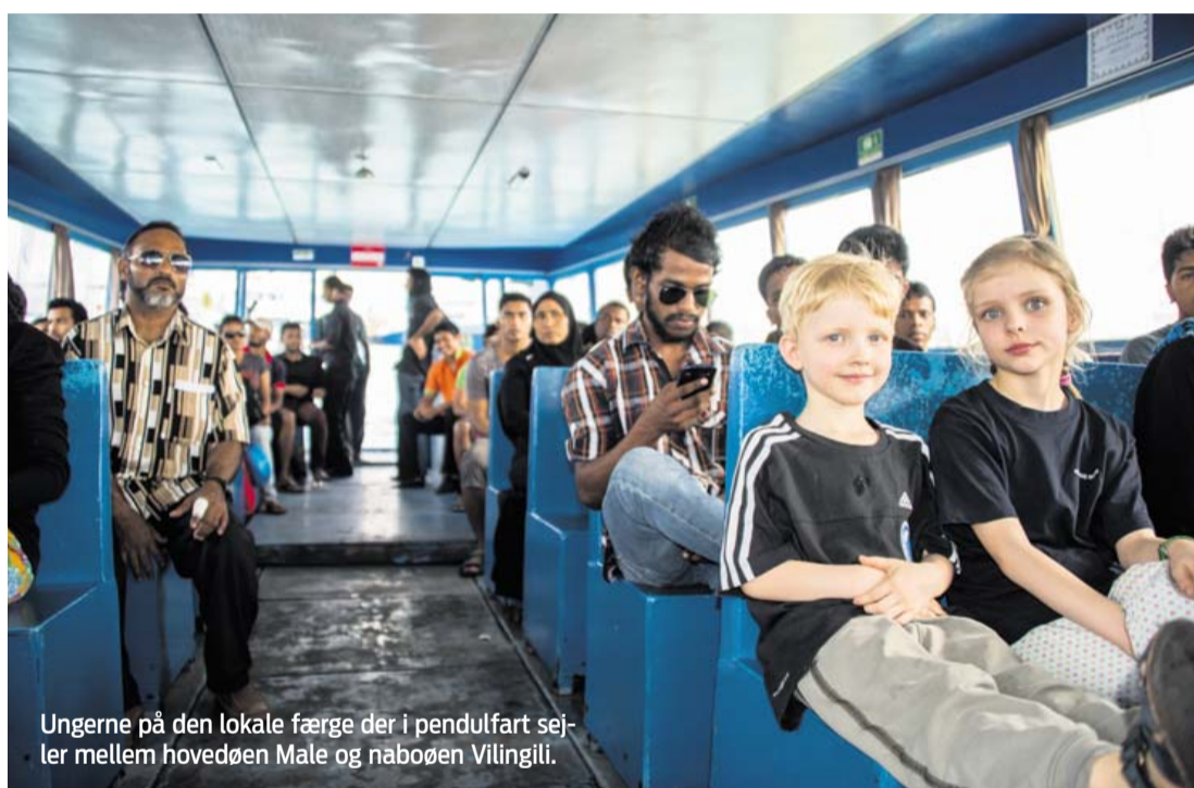
Ungerne på den lokale færge der i pendulfart sejler mellem hovedøen Male og nabøen Vilingili.