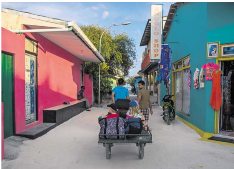
På vej mod vores guesthouse med lokal landtransport på Maafushi.