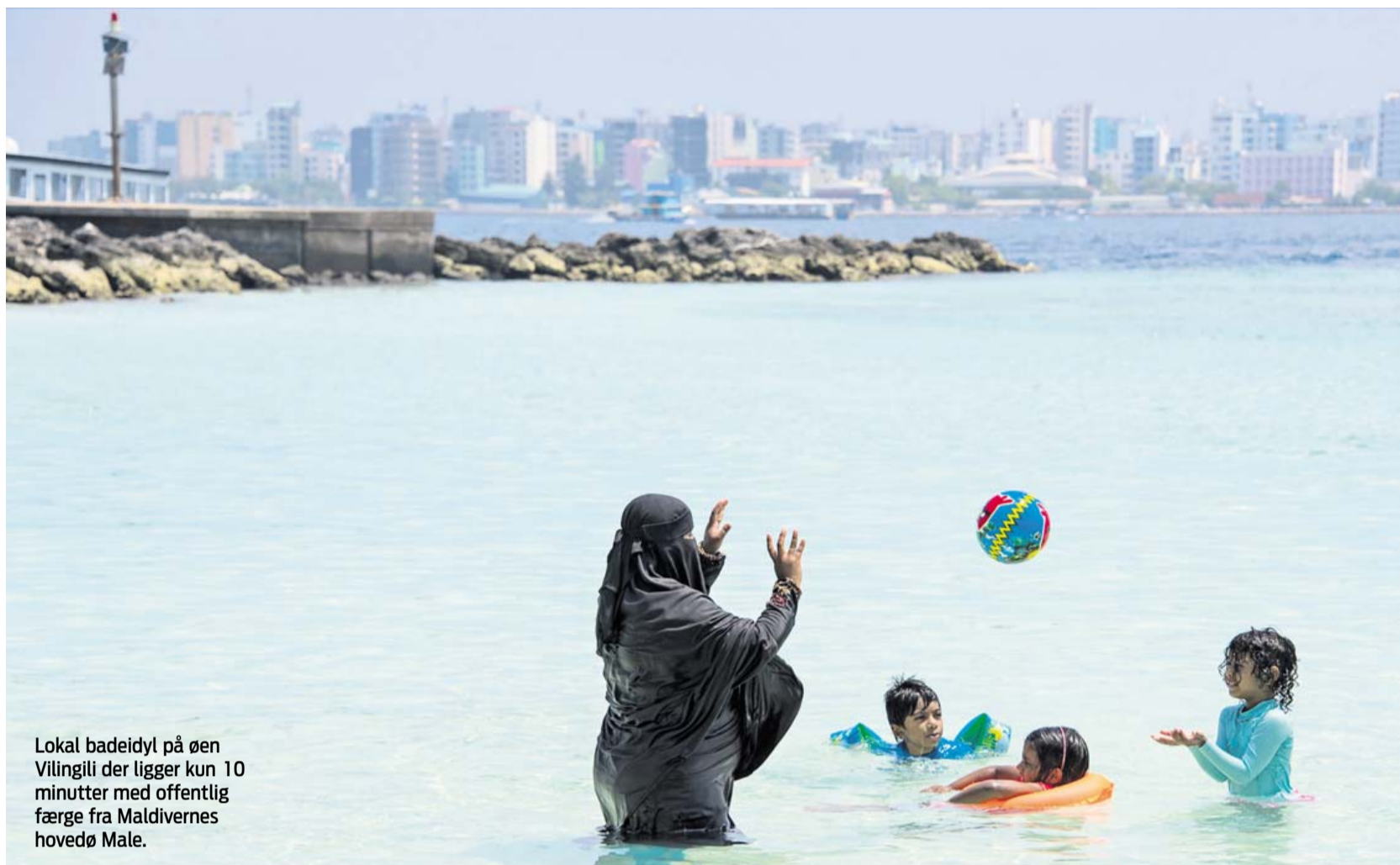
Lokal badeidyl på øen Vilingili der ligger kun 10 minutter med offentlig færge fra Maldivernes hovedø Male.