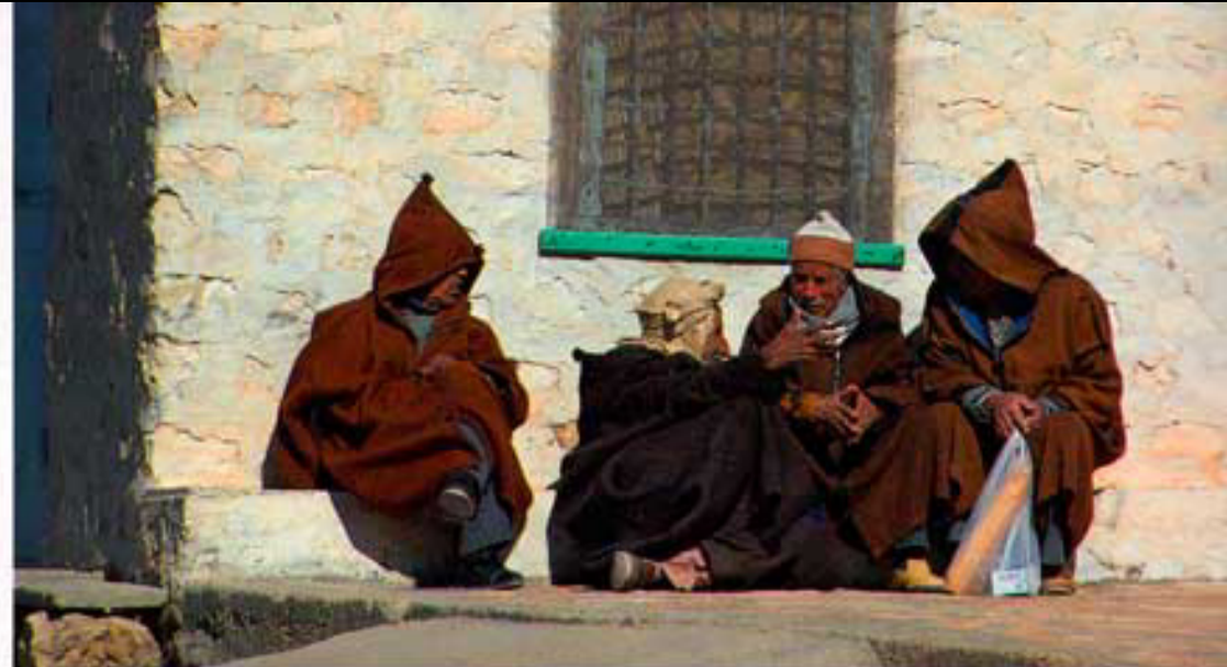
Berberer diskuterer verdenssituationen i en lille landsby, vi passerer i vores minimalistiske Fiat et sted i det sydlige Tunesien.

Da solen står lavt på himlen, og skyggerne bag klitterne begynder at vokse, myldrer det ind med firhjulstrækere fra Douz. Vi lægger dem alle bag os, og i en lille karavane bestående af seks kameler rider vi et par kilometer gennem Sahara til det efterladte romerske fort Ksar Ghilane, som oasen er