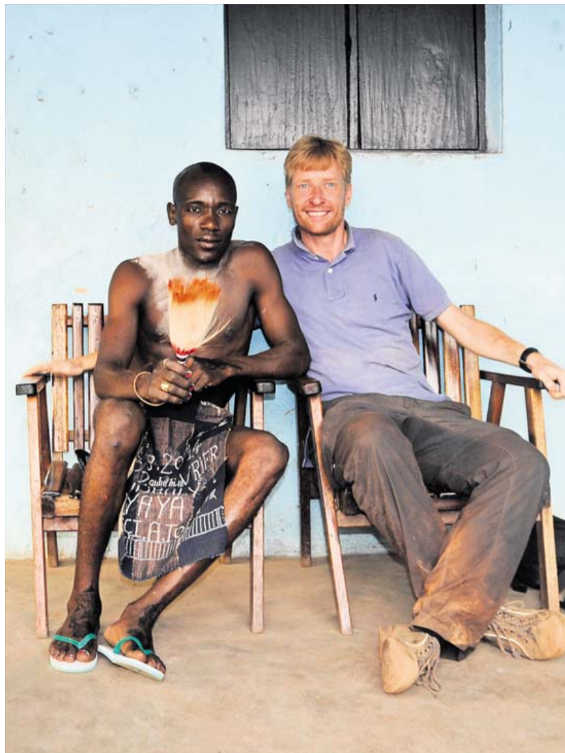
Artiklens forfatter og en af de netop udlærte poro-mænd.