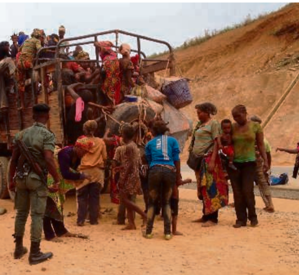
Med 'alternativ transport' ved checkpoint i Republikken Congo. Mange flygtede ud af byen grundet valg i Brazzaville, der skabte frygt for, at der skulle udbrude krig. Oktober 2015. Land 98.