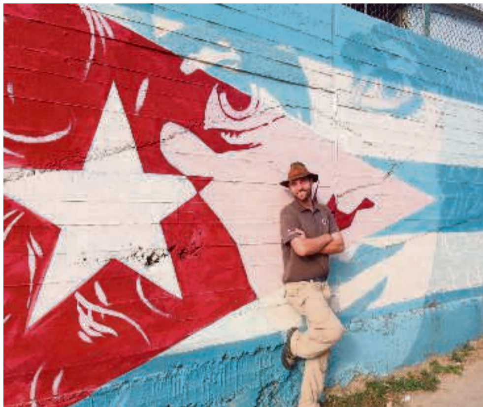
Ankommet til Cienfuegos i Cuba. Land 74. Februar 2015.