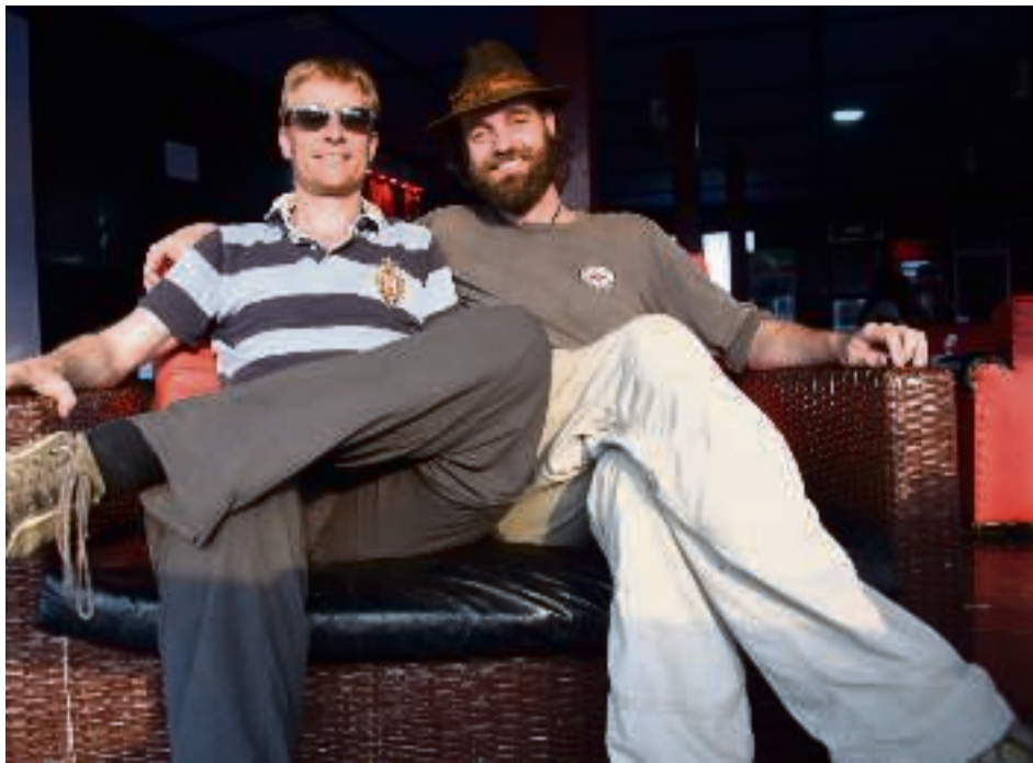
To medlemmer af De Berejstes Klub mødes ved Congo-floden for at lave dette interview. Republikken Congo februar 2016. Land 98.