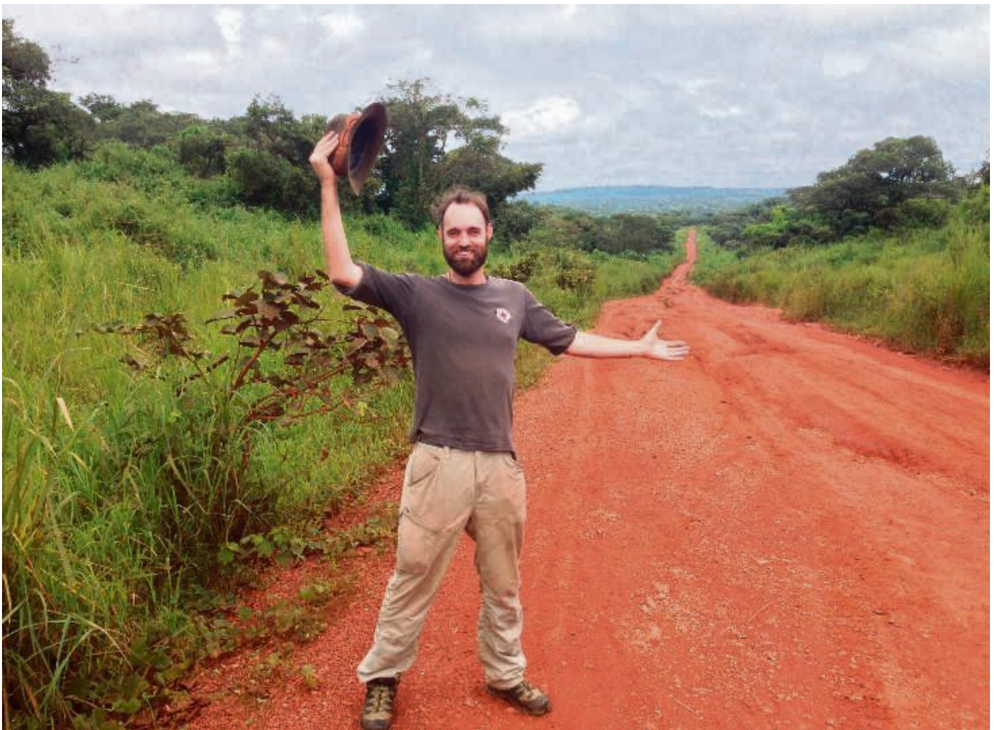
På hovedvejen, der fører fra Berberati i Den Centralafrikanske Republik til havnebyen Douala i Cameroun. September 2015. Land 96.