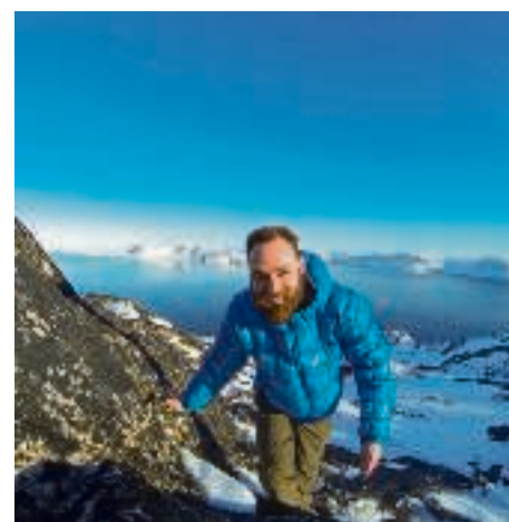
På udflugt i Qaqortoq, Grønland. Februar 2014. Land 40.