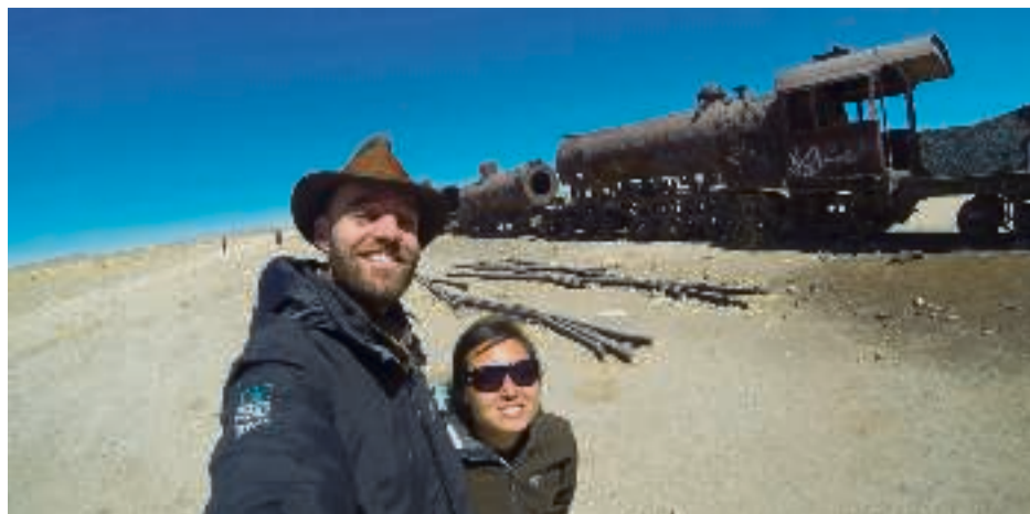
Torbjørns får besøg af sin kæreste i Bolivia ved togkirkegården, inden de forsætter over Salar de Uyuni på vej til Chile. September 2014. På vej til land 56.