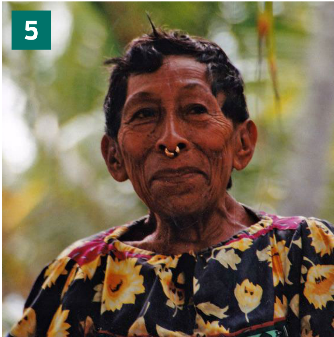
Kvinde fra Kuna-folket på San Blas-øerne.