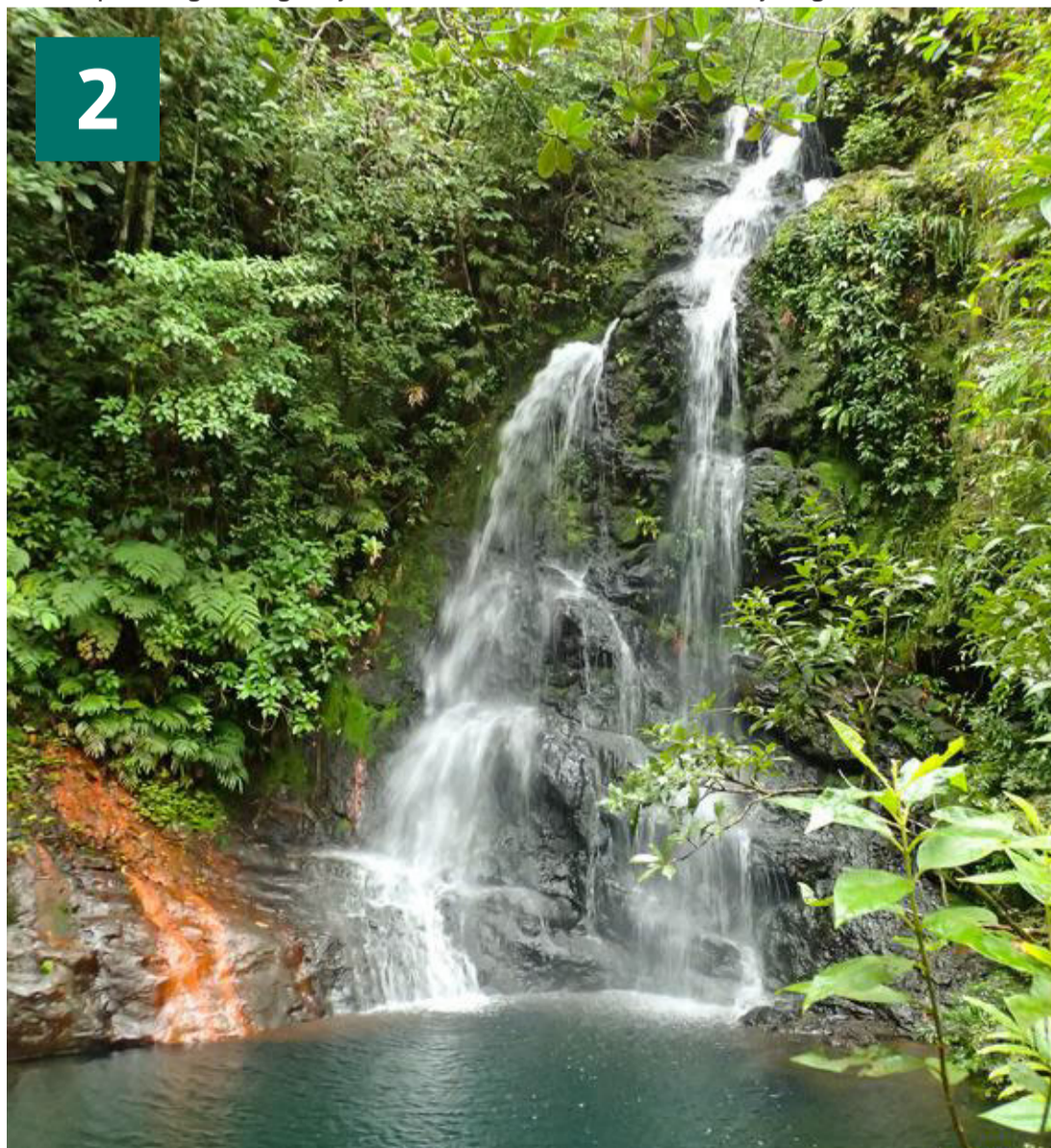
Cockscomb Basin Wildlife Sanctuary i Belize.

” Skjult dybt inde i junglen fungerede templet i gamle dage som mayaernes hovedsæde, og med de overgroede limstenstempler ligner området noget fra en Indiana Jones-film.