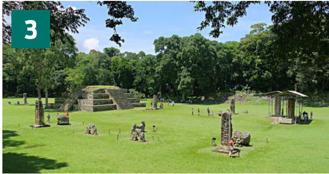
Honduras er kendt for Copán-mayaruinerne.

Råder du over din egen yacht, eller kan du på anden måde skaffe dig privat transport, så kan du desuden besøge de enestående San Blas-øer, beboet af Kuna-folket. Her kan man spotte kæmperokker på lavt vand, og der skyller jævnligt kæmpekonkylier op på de kridhvide strande. ■