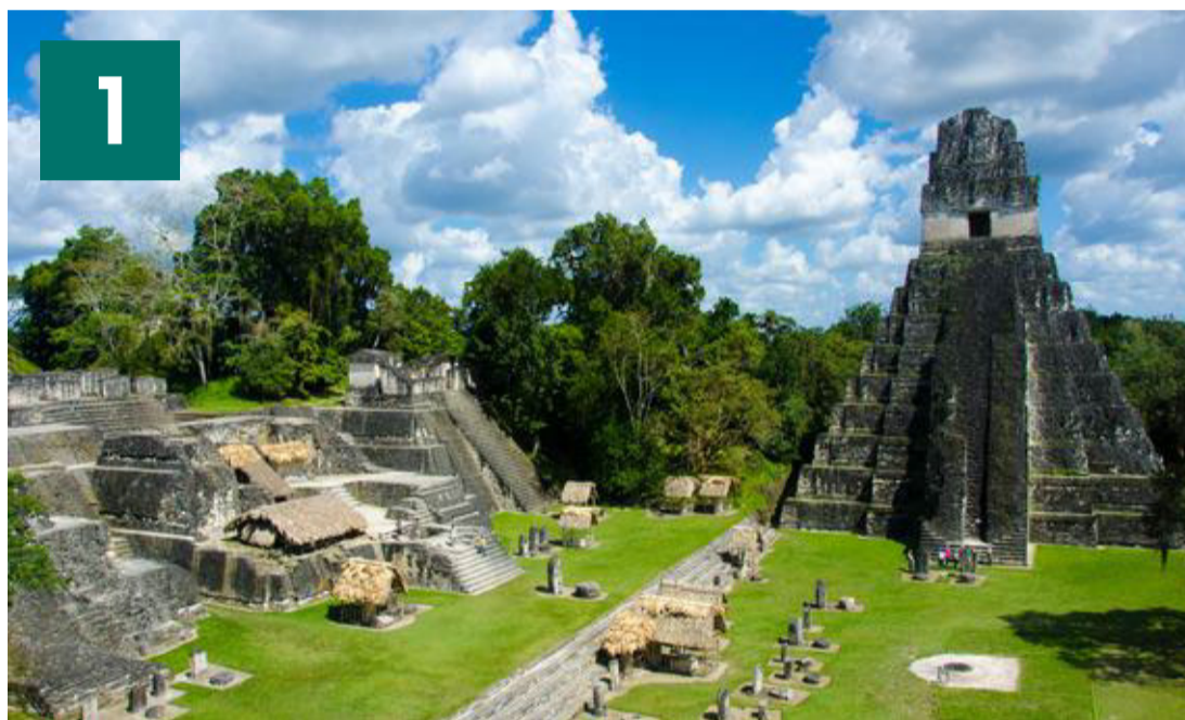
Tikal-templet var i gamle dage mayaernes hovedsæde i Guatemala.

Ud over mayaruiner og dyrespottning byder Belize desuden på havkajaksejls over Glover-