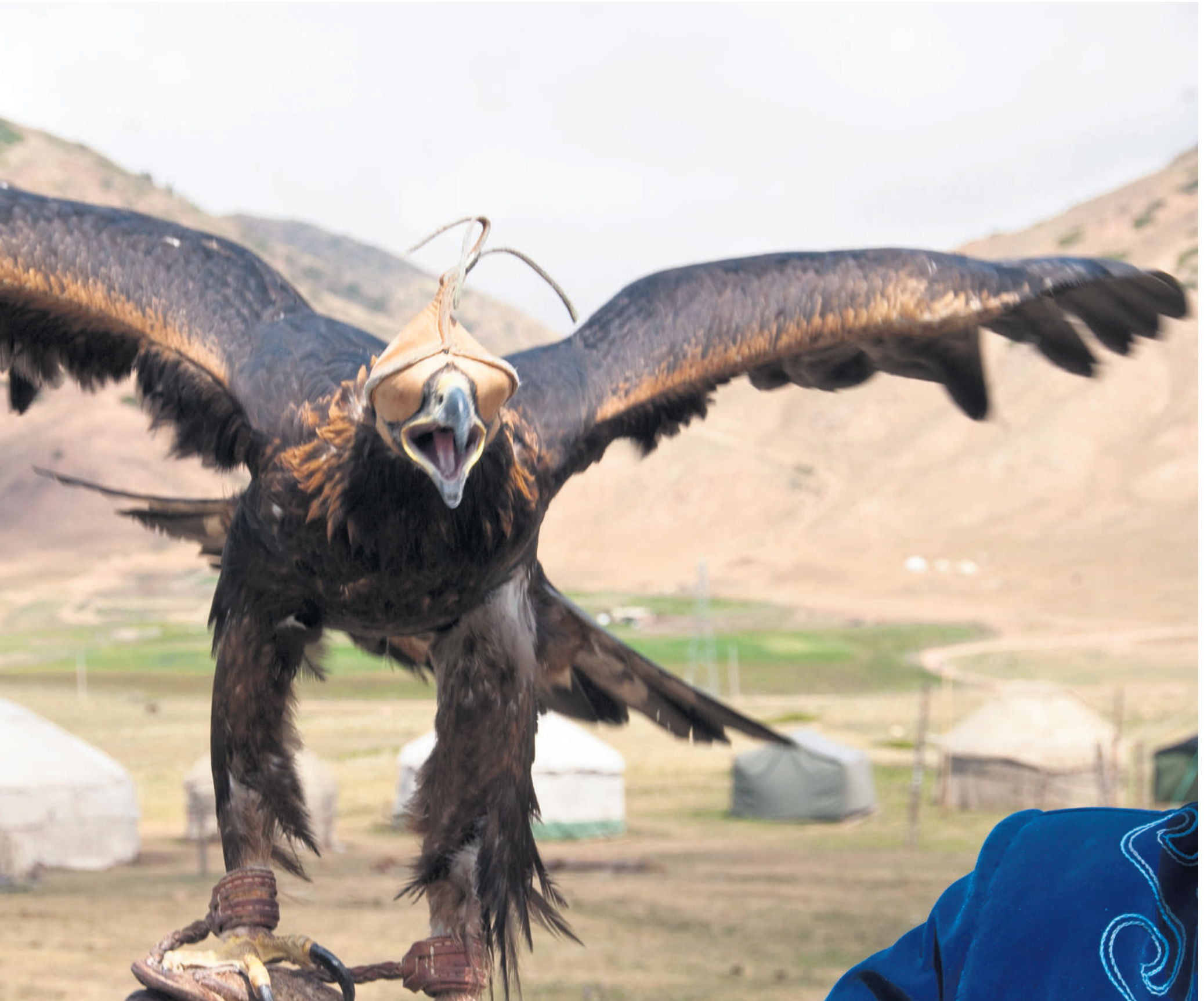
Ørnejæger med sin ørn i bjergene nær Bokonbaevo i Kirgisistan.