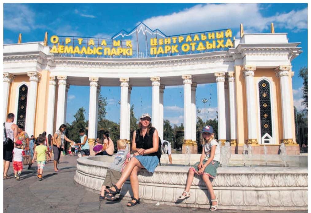
Gorky Park, Almaty, i Kasakhstan.