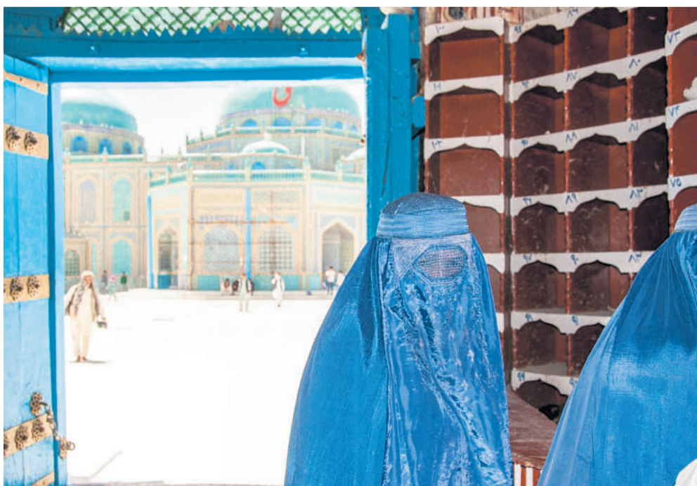
Foran den blå moske, Mazar-e-Sharif, i Afghanistan.