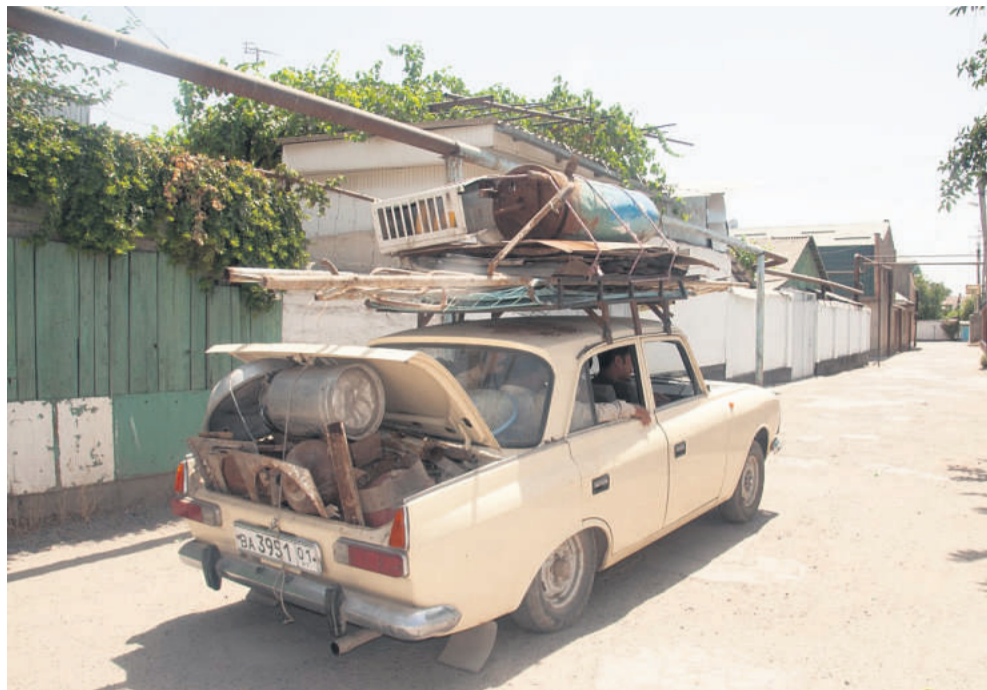
Transport i Dusjanbe i Tadsjikistan.

Rejsetidspunkt: Centralasien byder på kolde vintre og varme somre [20-40 grader].