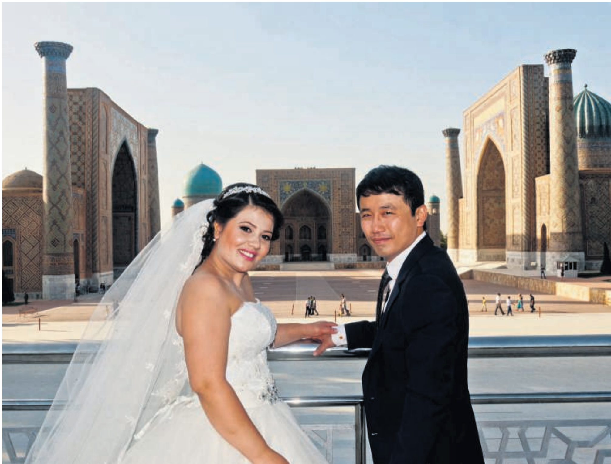
Bryllup foran Registan-pladsen i Samarkand, Usbekistan.