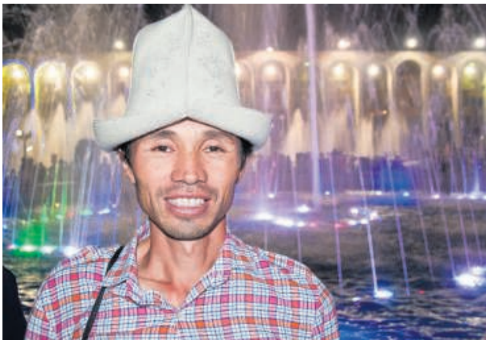
Ved et stort springvand i Kirgisistans hovedstad, Bisjkek.

Antal indbyggere: 7 millioner. Hovedstad: Bisjkek.