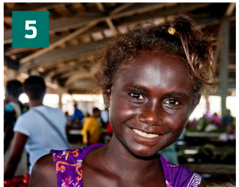
Salomonøerne: Pige sælger grøntsager på markedet i Honiara.