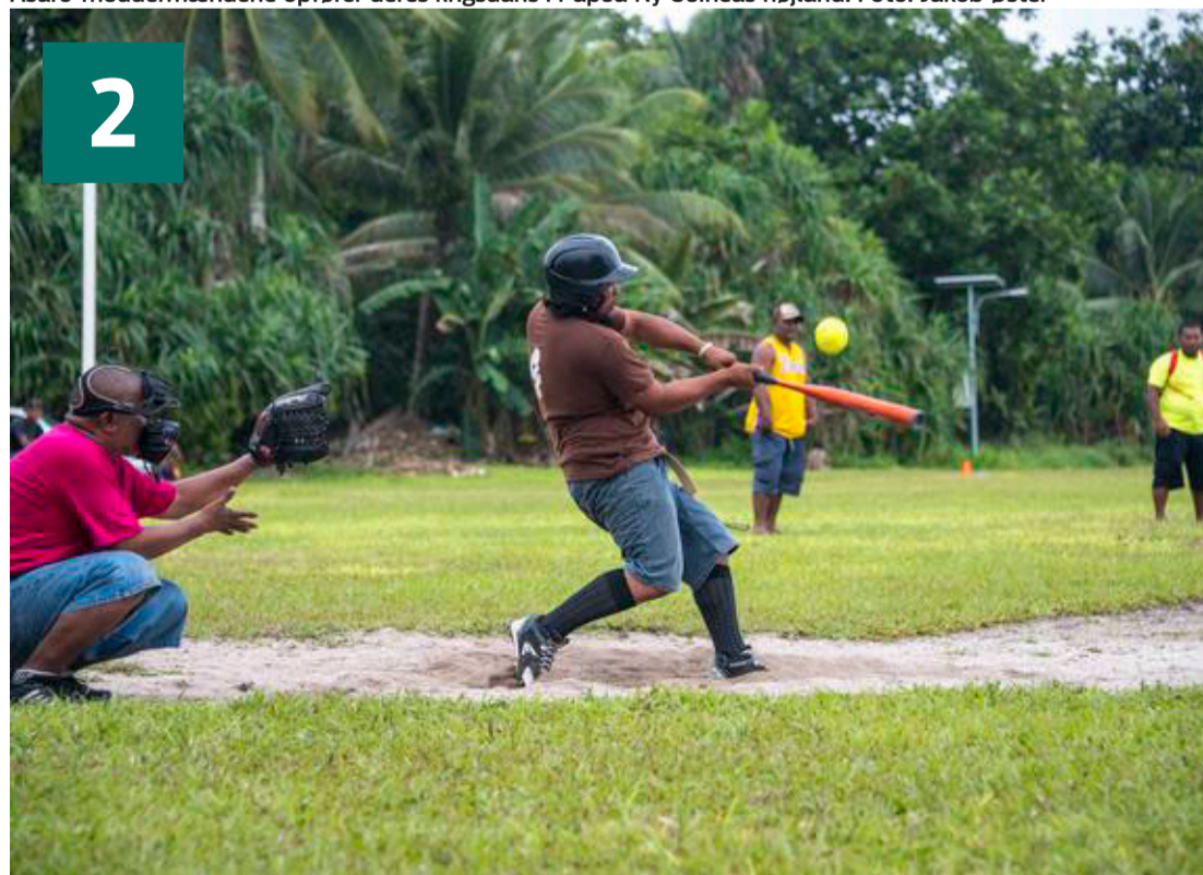
Lokalt liv på Marshalløerne. Baseball i byen Laura.