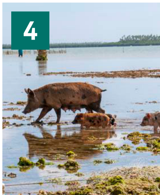
De forunderlige og fascinerende fiskende grise i Tonga.