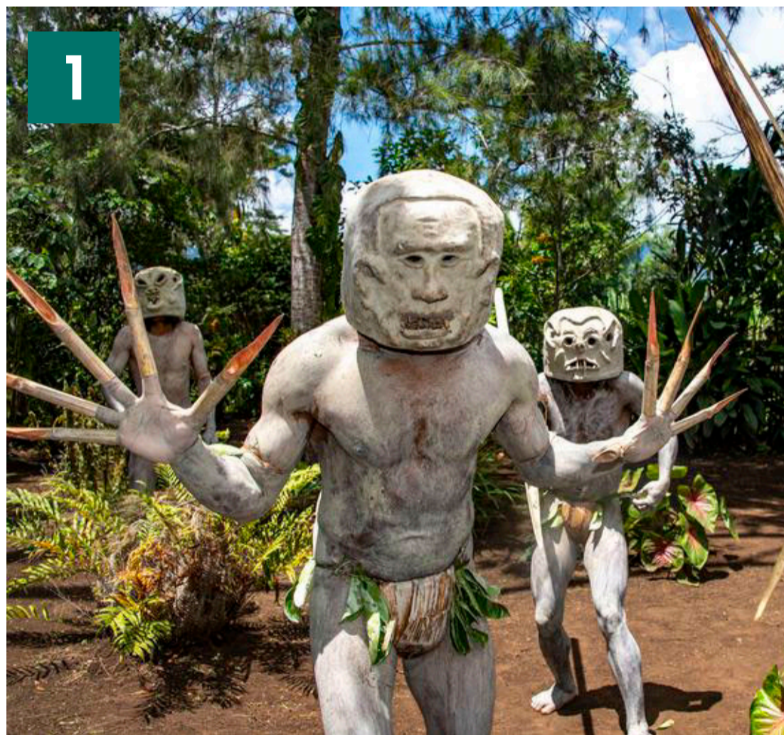
Asaro-mudder mændene opfører deres krigsdans i Papua Ny Guineas højland.

Et godt kulinarisk bekendtskab er palmetyv (kokoskrabbe) eller stillehavsskruepalme frugten.