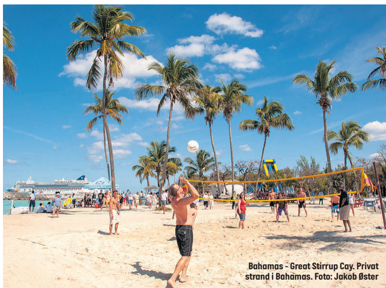
Bahamas - Great Stirrup Cay. Privat strand i Bahamas.