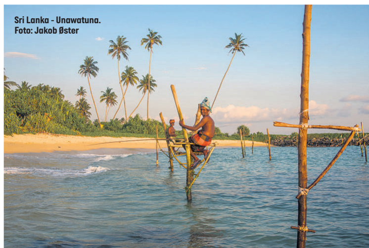
Sri Lanka - Unawatuna.