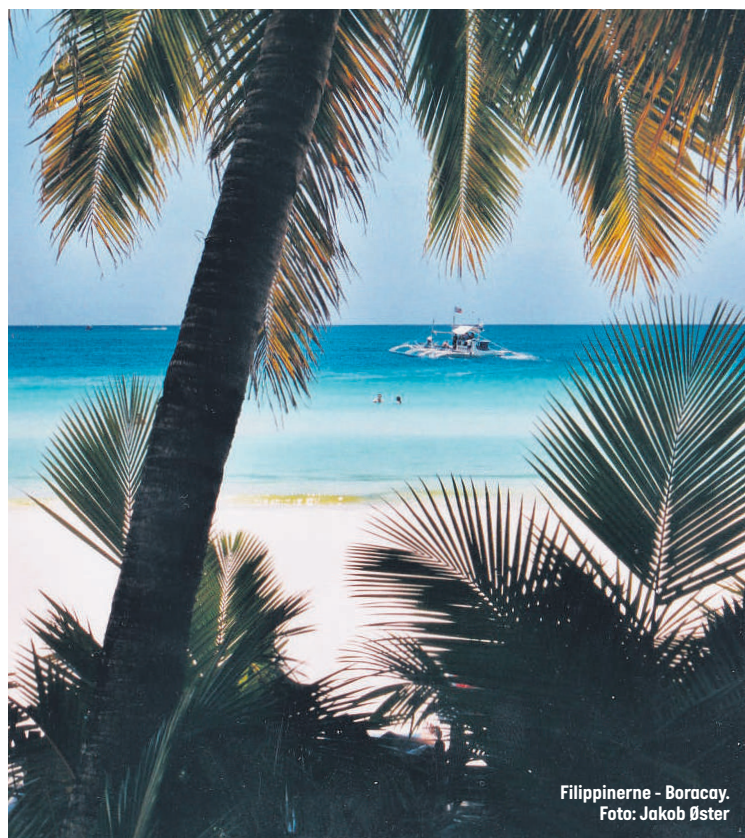
Filippinerne - Boracay.