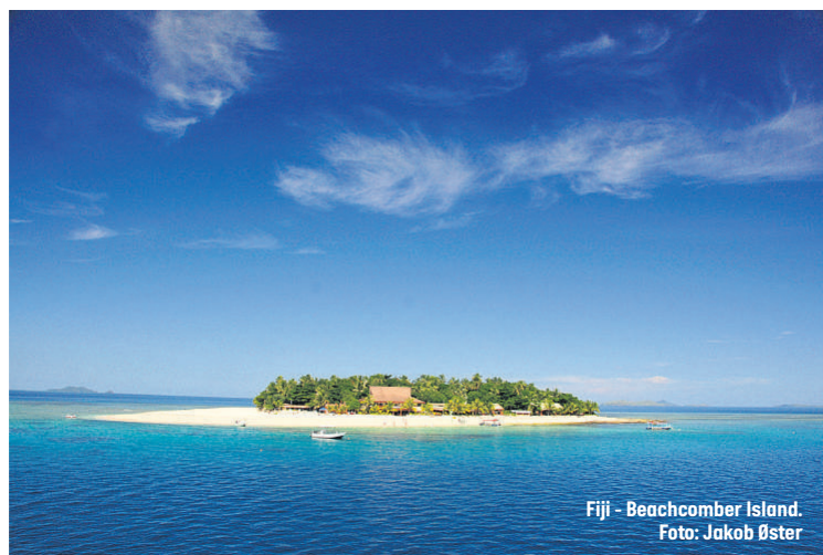
Fiji - Beachcomber Island.