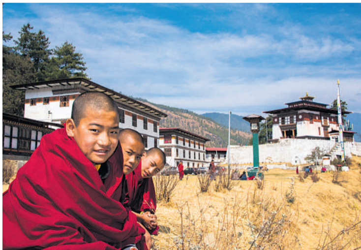
Drengemunke foran deres munkekostskole, der lyder navnet Den Store Lyksaligheds Palads.