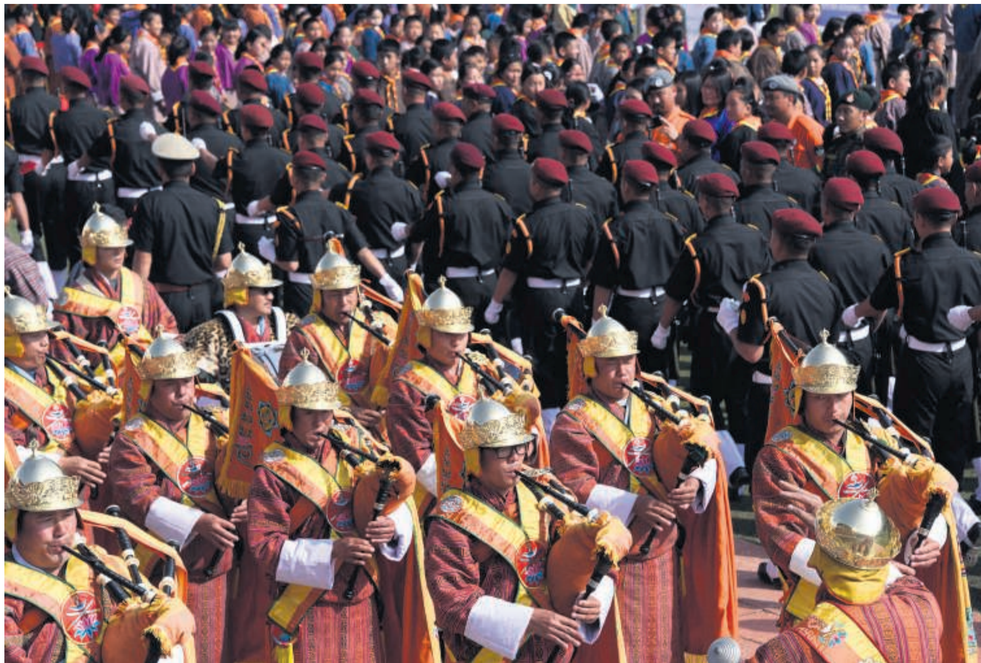
Marcherende politimænd og et orkester med gyldne hjelme spiller på sækkepibe og er en del af underholdningen i forbindelse med kongens fødselsdag på nationalstadionet i Thimphu.