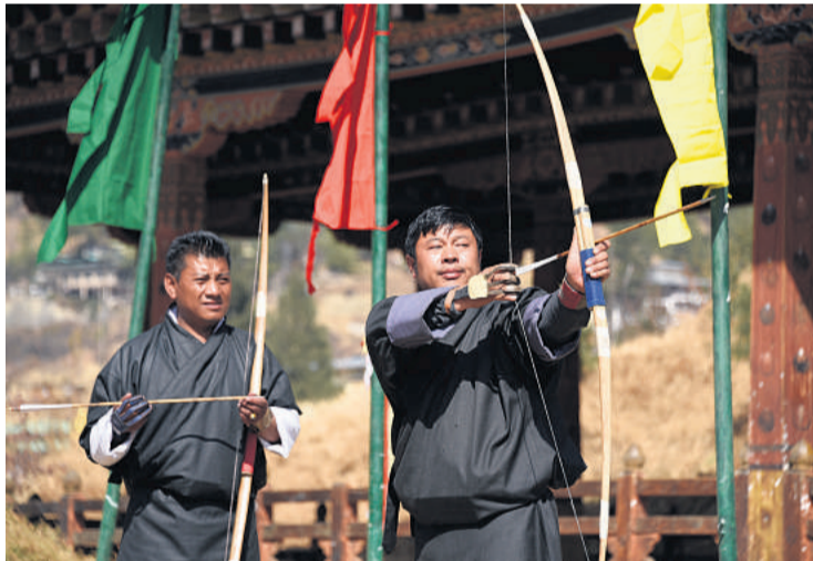
Bueskydning er Bhutans nationalsport. Der dystes både med moderne buer og - som her - med traditionelle træbuer.