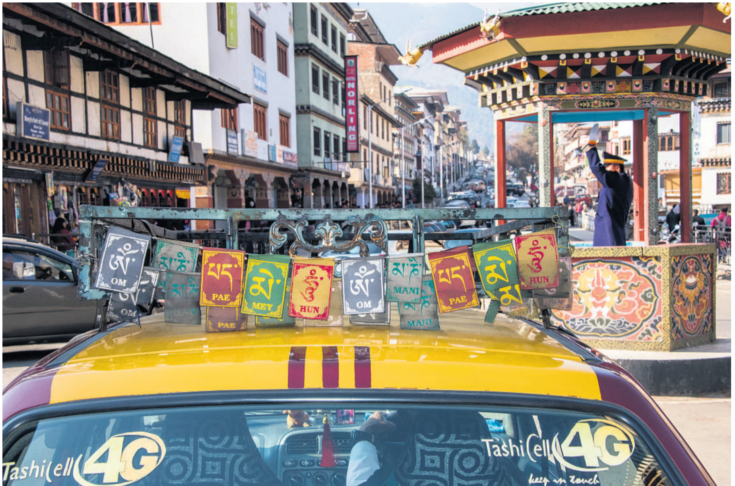
Hovedstaden Thimphu er en af de få hovedstæder i verden uden lysregulerede trafikkræds. I stedet dirigerer en betjent trafikken med hænderne i byens centrale kryds.

- Bare rolig, de lukker allerede ved midnat, siger Loday, da han fornemmer min bekymring i forhold til morgendagens bjergvandring.