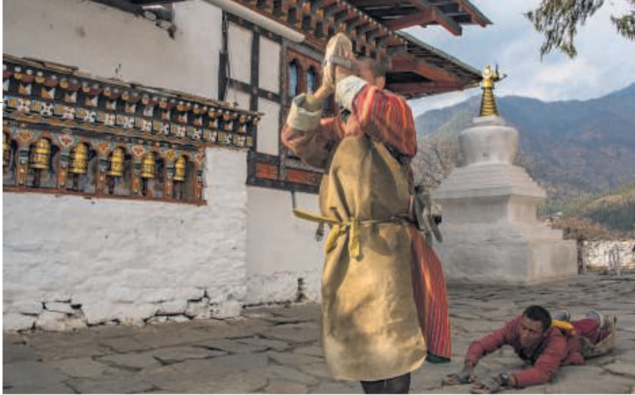
Munk foretager glidefald - eller prostration - frem mod Druk Choeding-klosteret i Paro.

De griner næsten uden undtagelse, når det går op for dem, at jeg har lært en sætning på deres eget sprog. I præcis det øjeblik trykker jeg igen på kameraets udløserknap og får der-