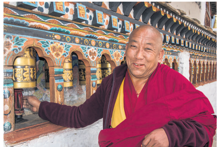
Bedehjul foran Druk Choeding-klosteret i Paro.

Insomnia hedder den natklub, vi frekventerer, og som navnet antyder, lukker den overhovedet ikke ved midnat. Efter kongens fødselsdag er der nemlig dikteret tre helligdage, og så behøver diskoteker ikke lukke tidligt.