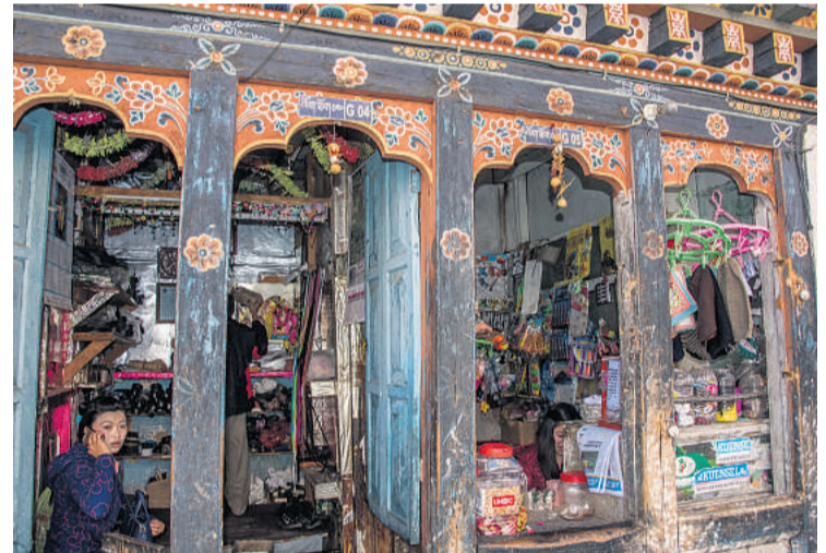
De fleste bygninger i Thimphu, er moderne, men et par oprindelige træhuse er bevaret og bruges som butikker.