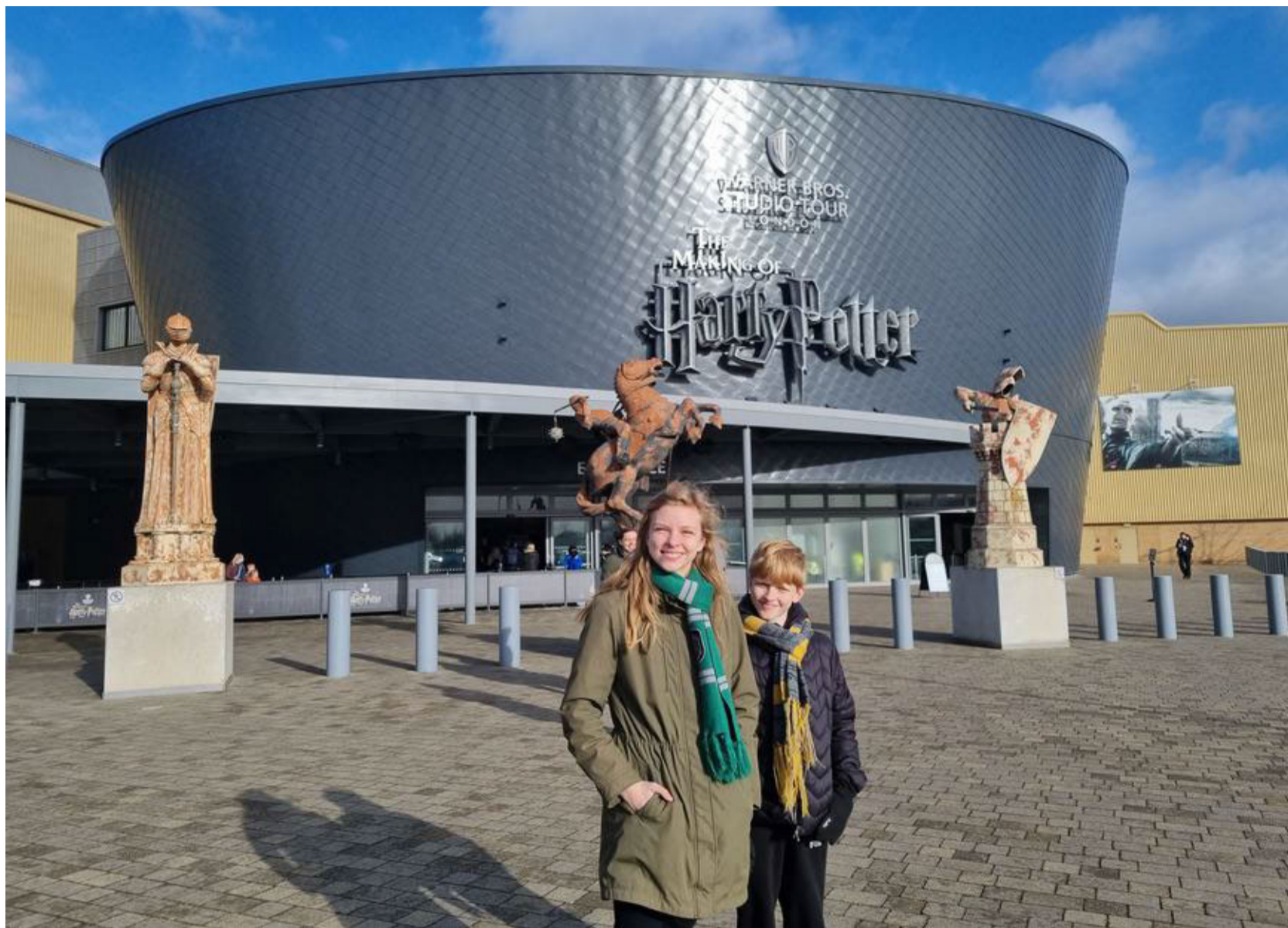
Foran Harry Potter-studierne. Tidligere husede bygningerne verdens største flyfabrik.