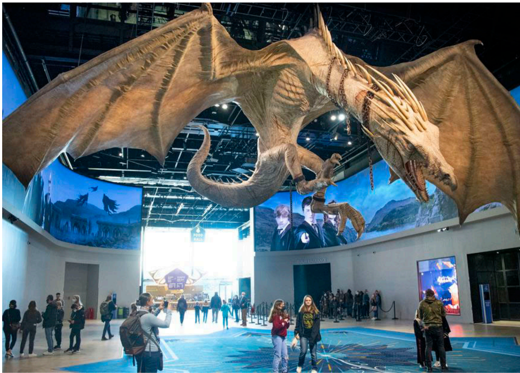
Dramaet udspiller sig straks i foyeren i hovedbygningen.