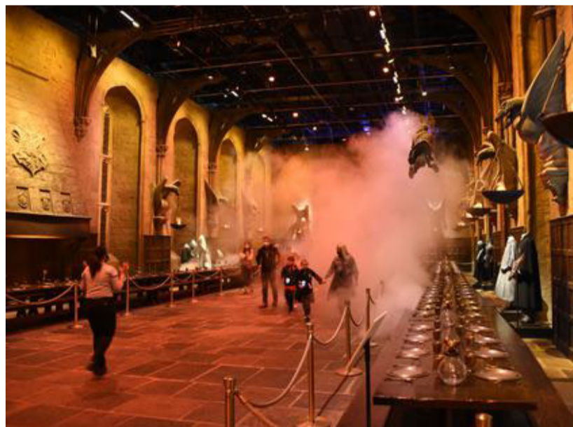
Hogwarts enorme Storsal.

► kirke. Det finder jeg snart efter ud af ikke er nogen tilfældighed, for salen er modelleret efter "The Great Hall" i Kristuskirken i Oxford.