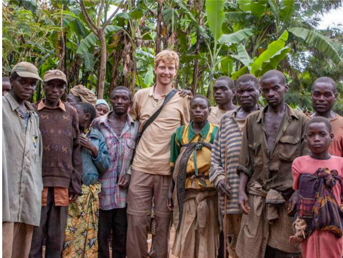
Hos pygmæerne i Uganda, 2006. Land #82.