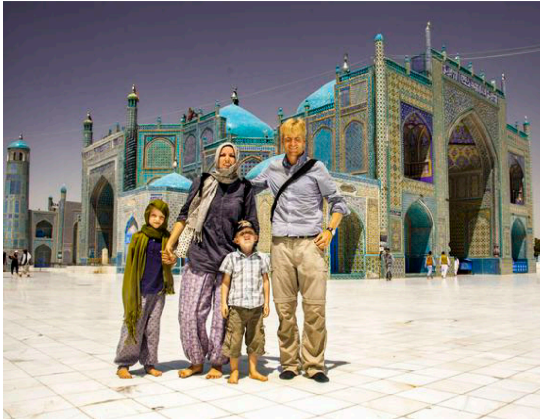
Med familien foran Den blå moské i Mazar-e Sharif i Afghanistan, 2014. Land#148.

»Sidste sommer kørte vi til Lofoten i Norge, som efter min mening har Europas smukkeste natur. Jeg vil altid være draget af, hvad der venter rundt om de hjørner, der endnu ikke er udforsket.« ■