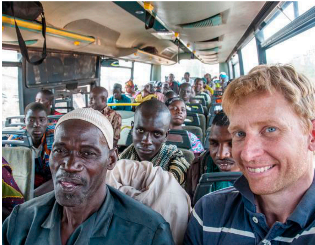
I lokalbus i Mali, 2014. Land #143.