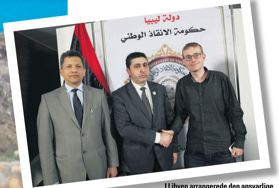
I Libyen arrangerede den ansvarlige for udenlandsk presse et møde med premierministeren.