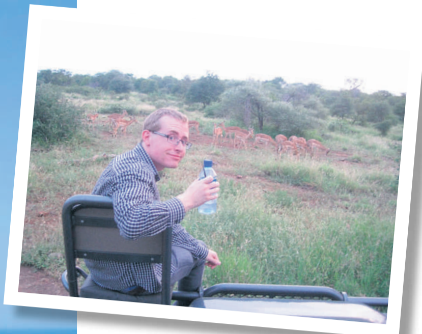
Unik safari oplevelse på det eksklusive Singita Lebombo Lodge, i Sydafrika