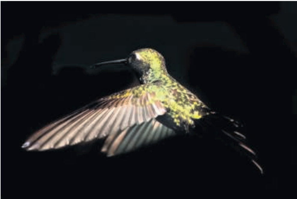
Med mellem 100 og 200 vingeslag i sekundet kan de små bikolibrier præcis ligesom almindelige kolibrier længe stå stille i luften.