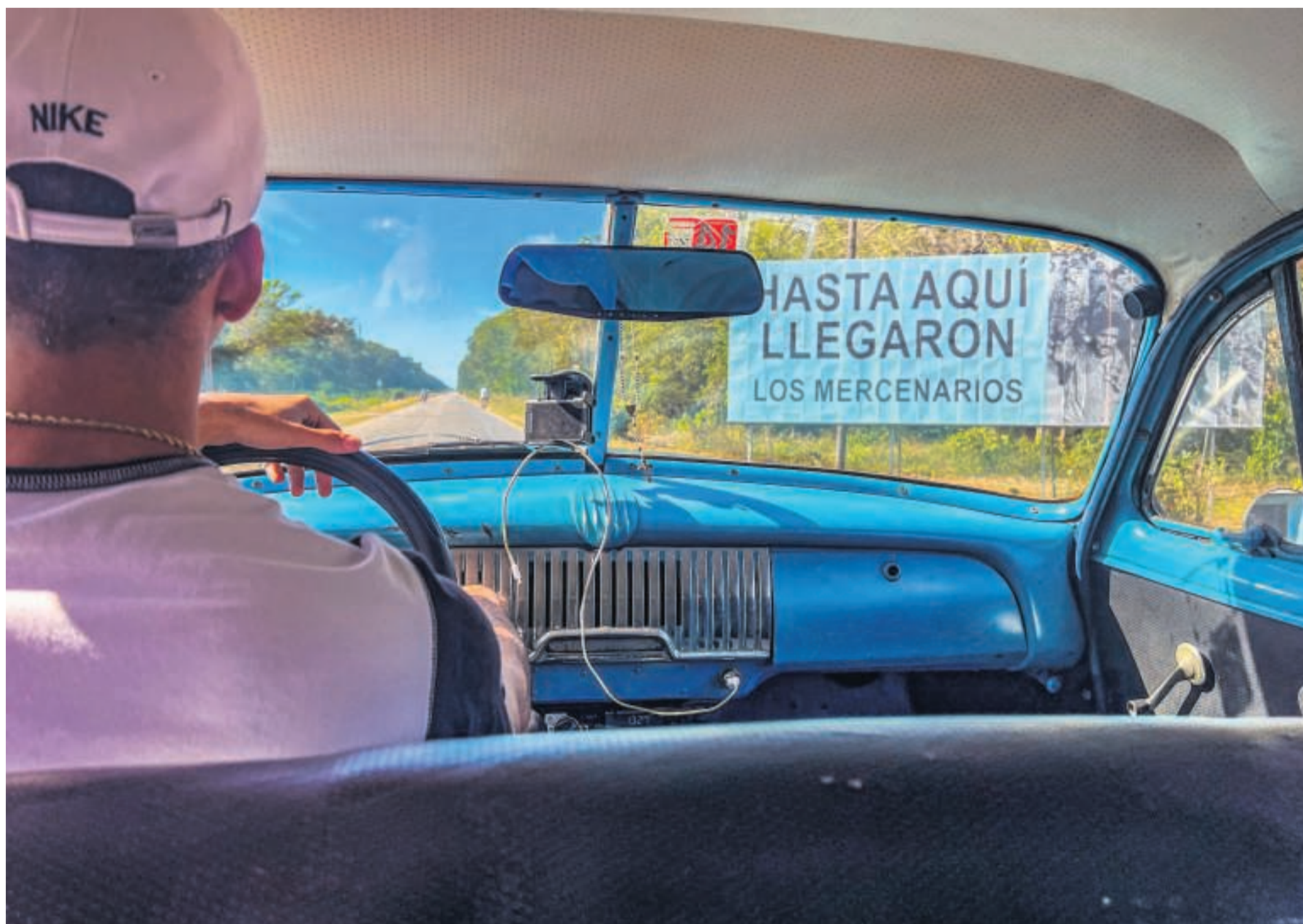
Et kæmpe billboard - måske et par kilometer fra Playa Larga - annoncerer, hvortil angrebet i Svinebugten nåede, inden det af Castros tropper blev slået ned.