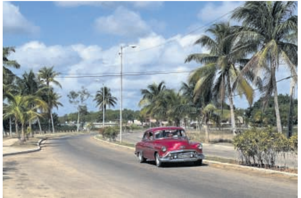
Overalt på Cubas veje ses gamle velholdte 1950'er amerikanybiler. Her lidt uden for landsbyen Playa Larga.