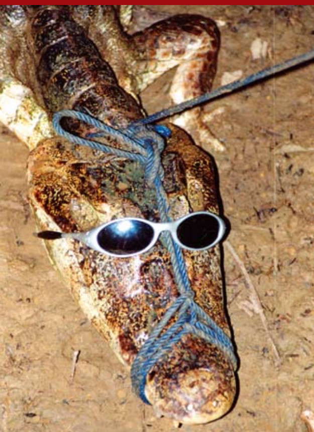
Krokodille som vi selv var med til at fange. Jeg gav den mine solbriller på for at beskytte den mod blitzlyset.

Helt så fandens karle var vi ikke senere på dagen, da vi fra båden iagttog det grumsede vand. Det var ulideligt varmt og pokkers fugtigt, og en svalende svømmetur stod ret højt på agendaen,