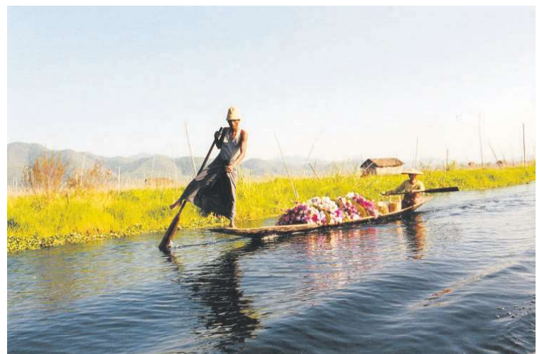
Mand fra intha-folket praktiserer den helt specielle ro-teknik på Inle-søen.

gæster på den måde betaler mere, end de ellers ville have gjort, og at vi på den måde støtter den økonomisk trængte lokalbefolkning. Forklaringen på, hvorfor mændene her på søen næsten uden undtagelse står op og ror, får jeg af den samme ansatte. Og den er ganske simpel: Nær søens overflade ligger