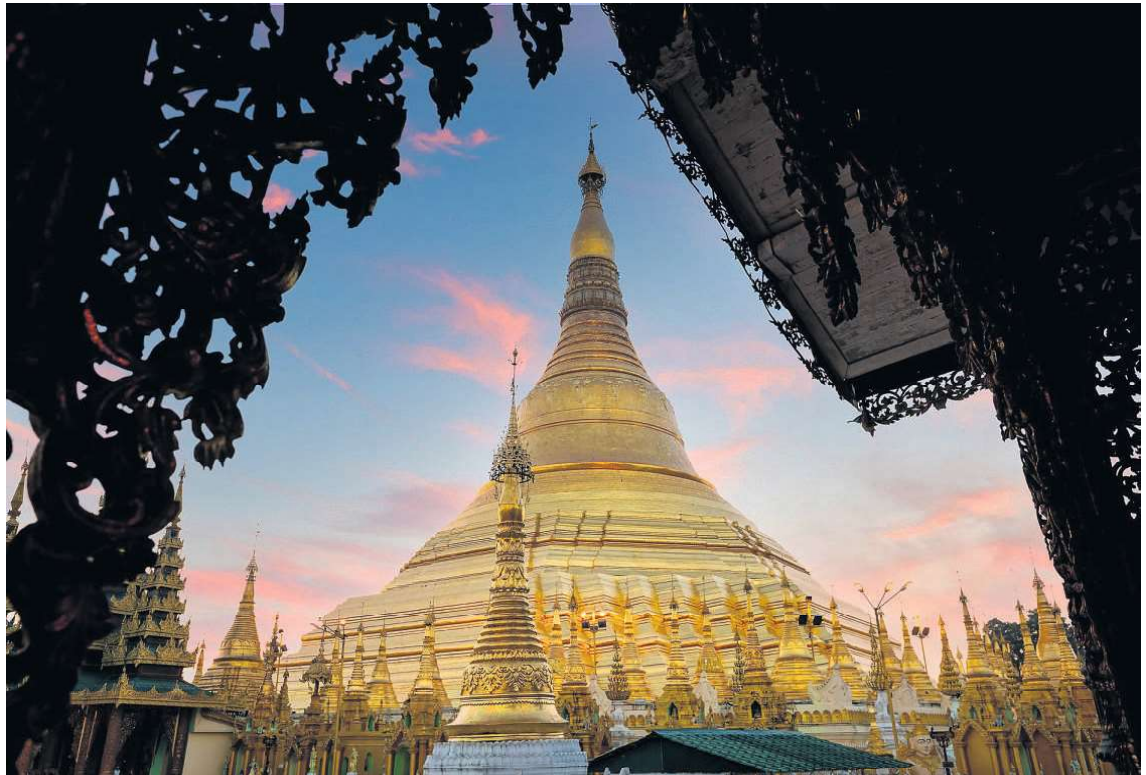
Shwedagon-pagoden i Yangon kendes også som Den Gyldne Pagode.

To af gruppens tre medlemmer måtte da også blandt andet tilbringe seks år i straffelejre for deres udtalelser, og i 2015 døde gruppens mest berømte medlem, Par Par Lay, af nyresvigt - angiveligt som følge af, at han havde drukket vand fra en forurenet kilde under et af sine fængselsophold. Nu er der kun sjældent optrædere, men husets garantis