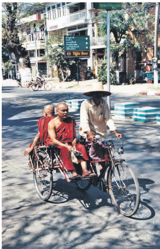
Munketransport i lokal cyclo med de lidt specielle modsatrettede sæder.