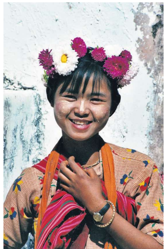
Mange af de unge piger har smurt thanaka - en pasta lavet af bark - i ansigterne. Det fungerer som solcreme, og de fleste har smurt det ud i store runde plamager på deres kinder.