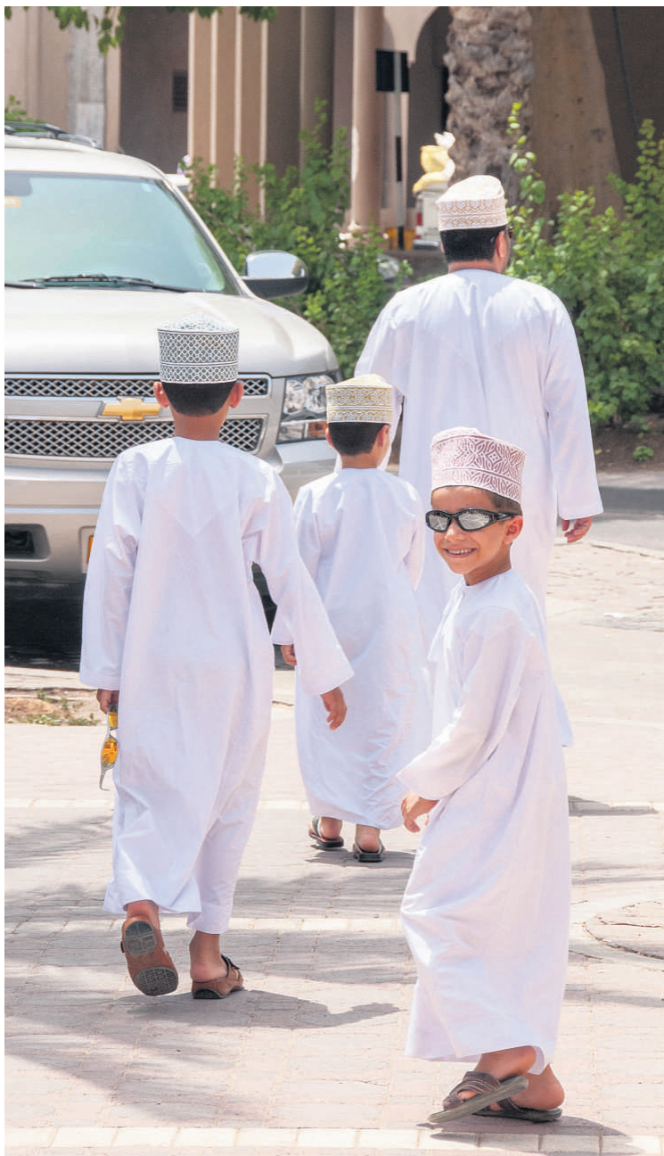
En af tre sønner sender i pletfrit hvidt tøj sender et stort smil i retning af fotografen.