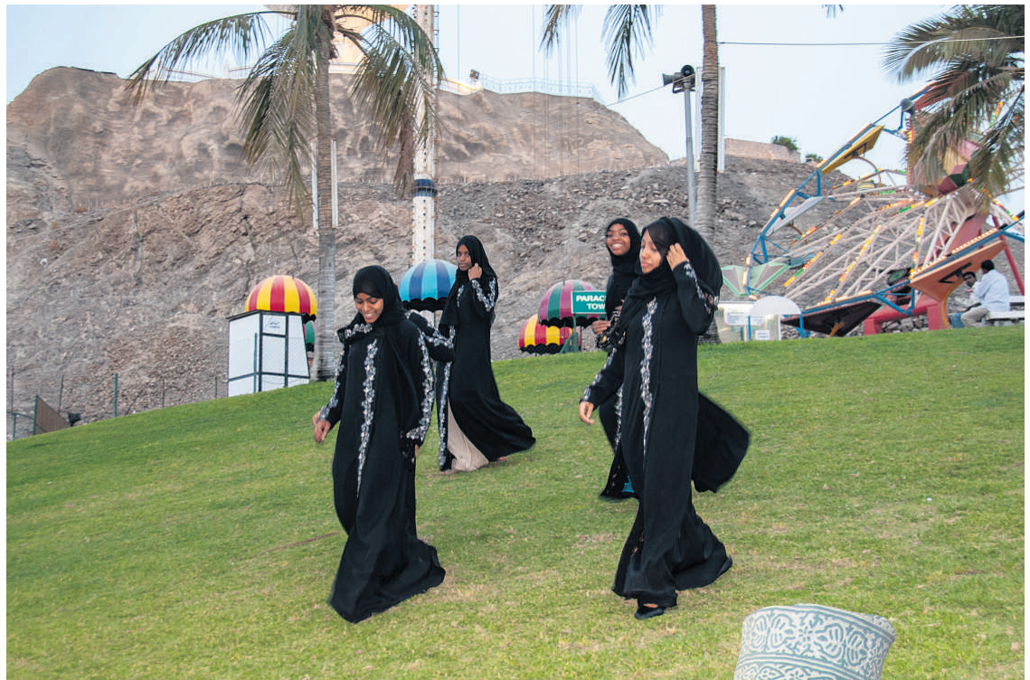
Lokale kvinder foran forlystelsespark i Muscat.

Efter at have besøgt både suppeskilpadder og hovedstaden ender vi til sidst i landets tid-