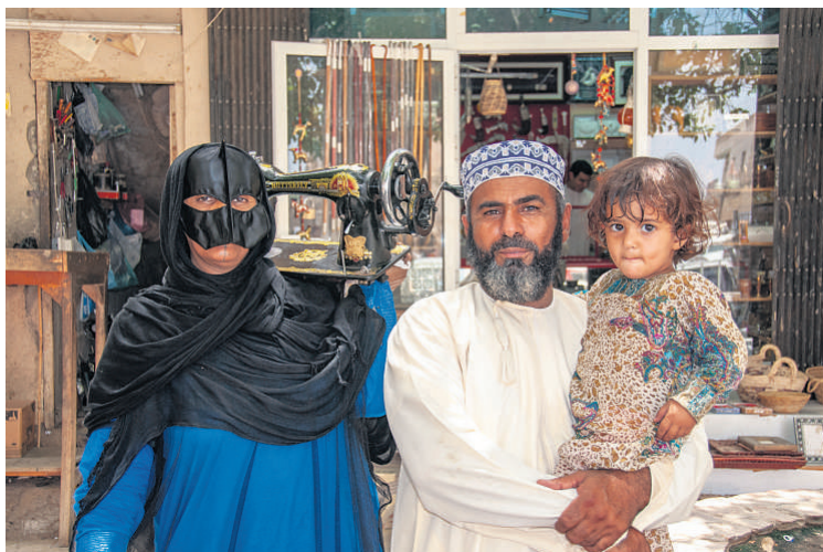
Muhammed og hans kone er beduiner og er kommet ind til Nizwa by for at få repareret deres gamle symaskine.