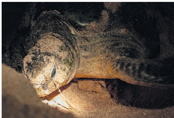
Kæmpeskildpadderne græder bogstaveligt talt salte tårer. Det gør de for at udskille havets salt fra kroppen.