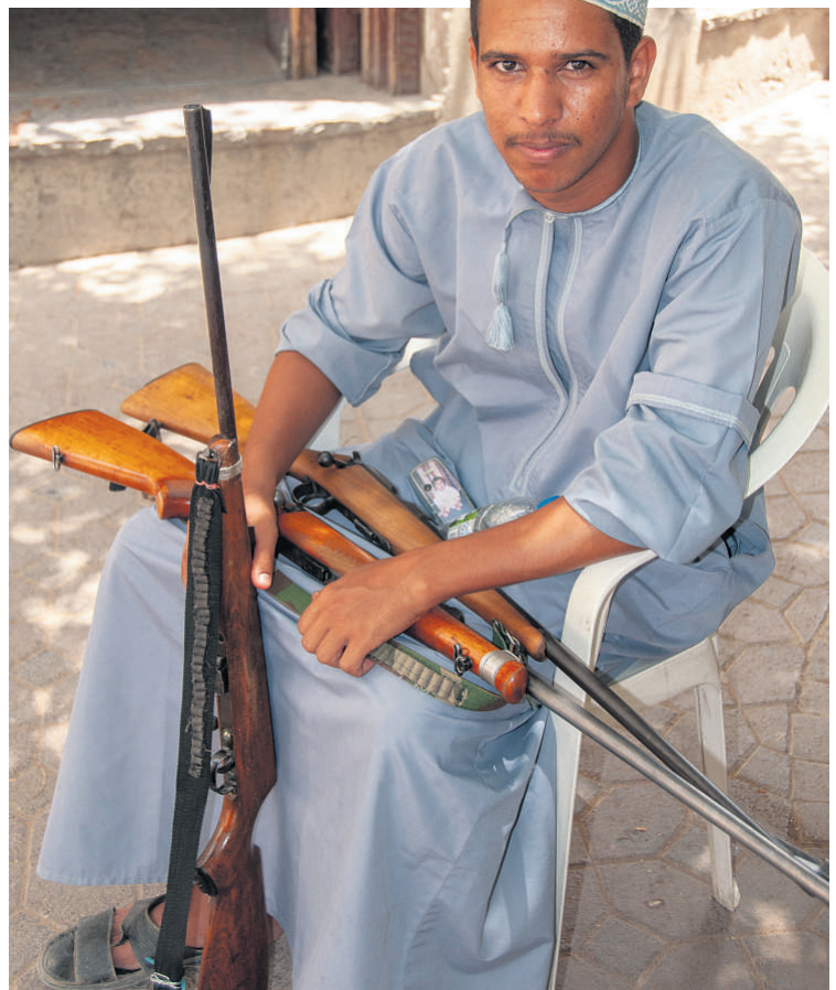
Der er våbenhandlere overalt i Nizwa, og mange lokale går rundt med geværer eller khanjar-dolke.