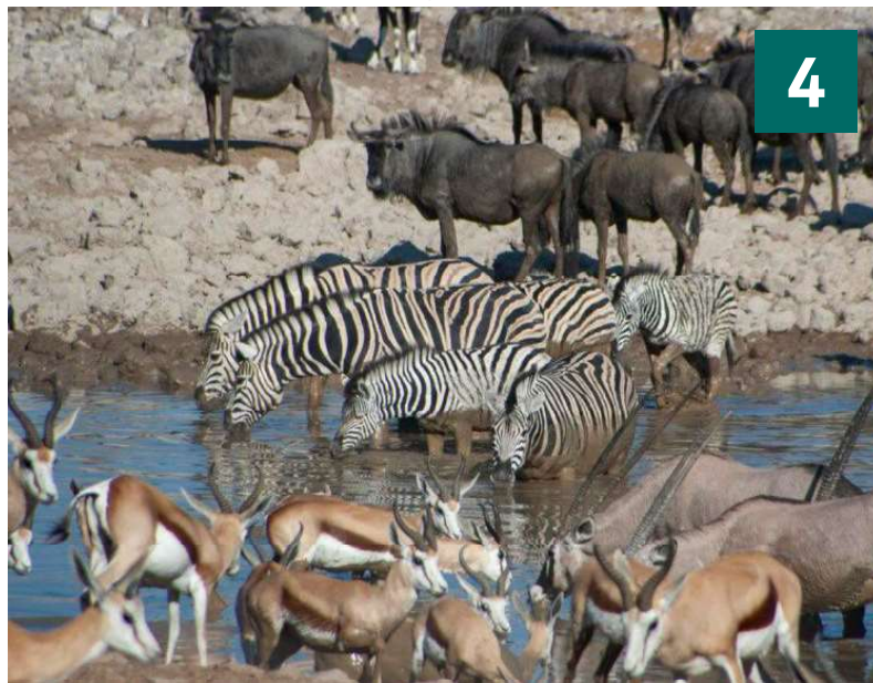
Der er rift om pladserne ved Okaukuejo vandhullet i Etosha.