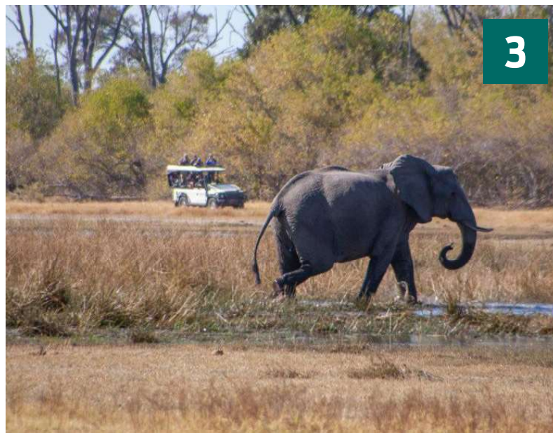
Soppende elefant i Moremi Nationalparken i Okavango-deltaet.

Alle Big Five-dyrene kan spottes her i parken, der mod øst grænser op til Lebombo-bjergene, der adskiller Sydafrika fra Mozambique. Siden 2002 har Krüger været sammenhængende med nationalparker i Zimbabwe og Mozambique, og dyrene kan frit bevæge sig mellem lande og økosystemer. Krüger huser både sorte og de sjældne hvide næsehorn. ■