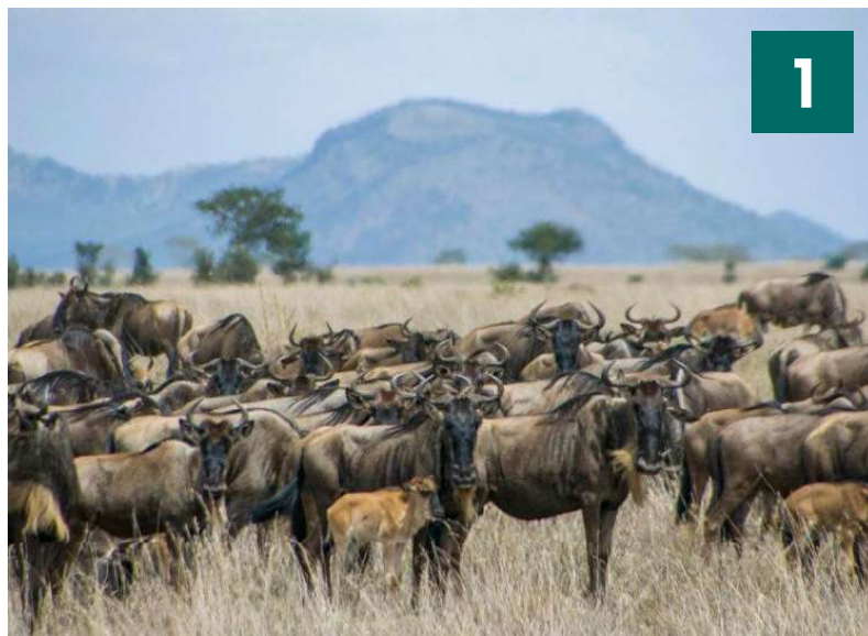
Gnuer ifærdes flok i Masai Mara.

Syd for Masai Mara og adskilt af grænsen mellem Kenya og Tanzania ligger Serengeti – verdens måske mest kendte safaripark – som også huser "The Big Five". Ligesom Masai Mara er parken kendt for den årlige migration af gnuer, som det meste af året opholder og forplanter sig i Serengeti. I februar undfanges dagligt omkring 8.000 gnuvalve.