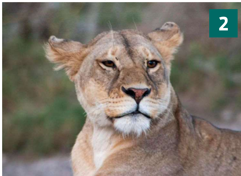
Serengeti er en af de bedste parker i verden at se vilde løver.

Ligesom i Masai Mara er her en meget stor koncentration af rovdyr. Inde i Serengeti tilbydes overnatning i lige fra luksushytter til simple campingpladser. Til manges overraskelse er de fleste campingpladser ikke indhegnede.