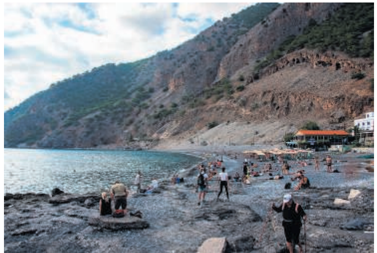
På denne sorte stenstrand i Agia Roumeli tog turen to ældste deltagere en lur, inden færgen førte os hjem mod vores all inclusive-hotel.

Bag os lægger vi snart efter den overraskende bjergrige, men skønne, græske ø. Vi håber en dag at vende tilbage til kysten med de smukke strande og til byen Chania med den imponerende venetianske havn. Men næste gang springer vi - til trods for at det ofte er de strabadserende og fælles oplevelser man husker længst - sandsynligvis vandreturen over.