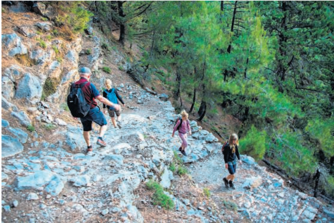
Trappetrinene i kløftens start er glatte, så det er med at holde tungen lige i munden.