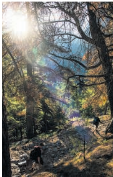
Samariakløften er med sine 13 kilometer en af Europas længste kløfter.

Med lidt andre ord fortæller de os, at vi ligner nogle, der har gjort i bukserne, da vi langsomt og ubehjælpomt forcerer hotel-