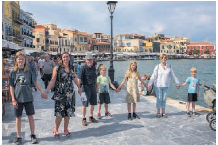
Familien samlet foran den venetianske havn i Chania.