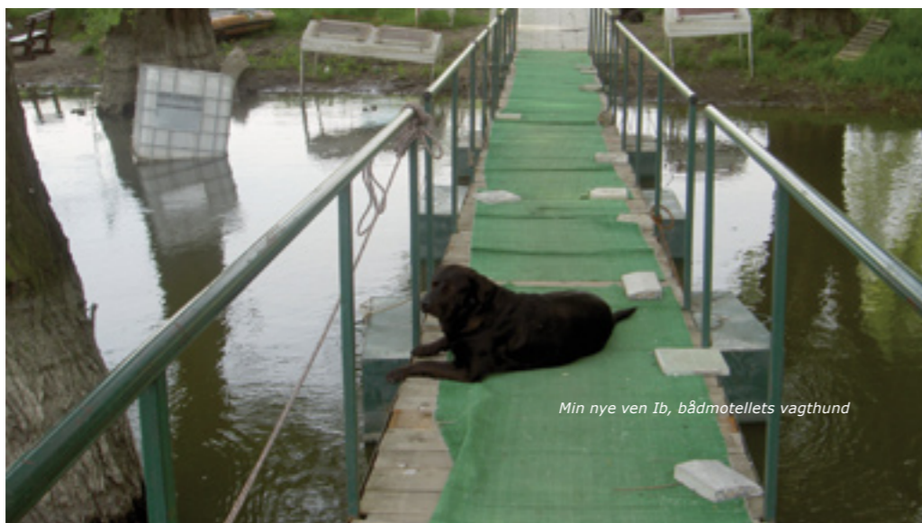
Min nye ven Ib, bådmotellets vagthund