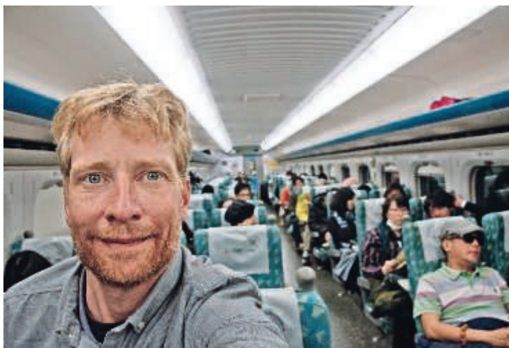
Rejselivs skribent i højhastighedstoget mellem Taipei og Yunlin.

Da jeg kommer retur til Taipei Main Station omkring midnat, er jeg så træt, at min hjerne nærmest er holdt op med at fungere. I skilteskoven på stationen kan jeg ikke finde et eneste skilt, der lyder som noget, jeg skal gå imod. Så jeg går bare ud af en tilfældig udgang, fordi jeg tænker, at jeg jo så kan orientere mig udenfor og bare gå rundt om stationen. 30 minutters rask gang, to krydsede motorvejsbroer, og hvad der føles som to tilbagelagte kilometer, senere finder jeg endelig forsiden af stationen og snart derefter mit klaustrofobiske, men topmoderne hostel. Jeg smiler lidt i skæggot over, det ikke var tidligere på dagen, jeg