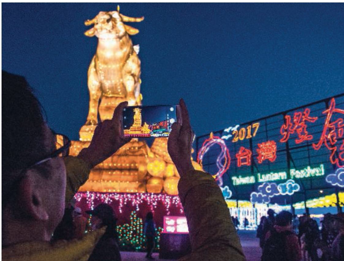
Taiwans officielle lanternefestival fandt i 2017 sted i Yunlin. Den varede ni dage.

sender synkront de vældige rispapirslanterner mod himlen. I andægtig stilhed nyder forsamlingen det magiske syn af de vuggende opstigende lysobjekter. Efter få sekunder er de vældige lamper kun små prikker på himlen.