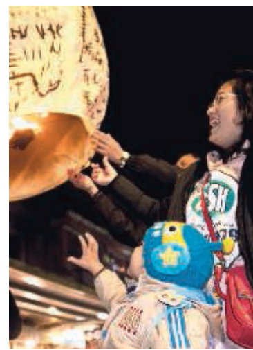
En familie opsender deres lanterne i Pingxi og håber på, at deres ønsker skrevet på lanterne går i opfyldelse.

Bedste rejsetidspunkt: Lanternefestivalerne finder sted i slutningen af februar eller i starten af marts. Datoer varierer fra år til år med månkalenderen.