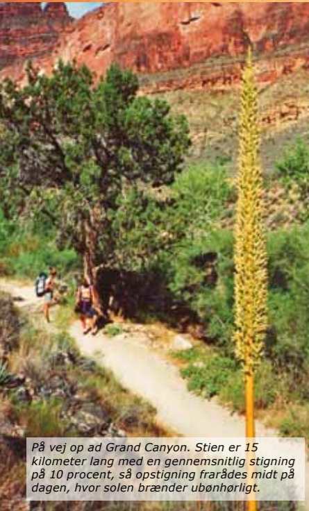
På vej op ad Grand Canyon. Stien er 15 kilometer lang med en gennemsnitlig stigning på 10 procent, så opstigning frarådes midt på dagen, hvor solen brænder ubønhørligt.