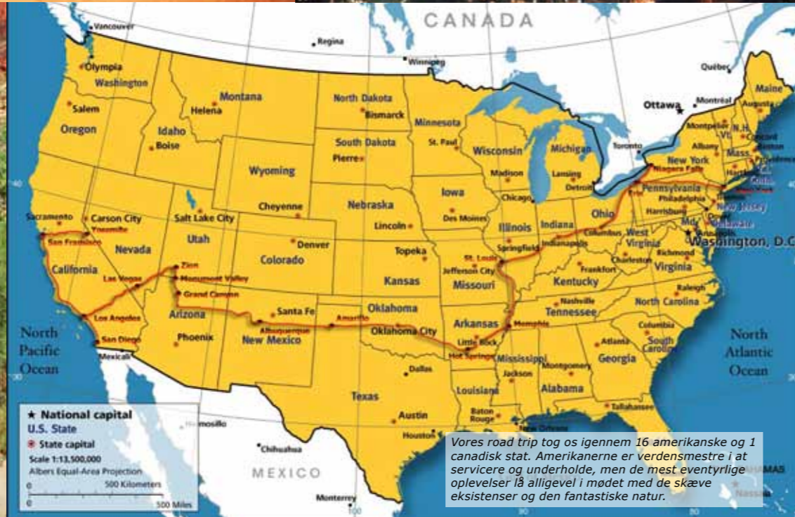
Vores road trip tog os igennem 16 amerikanske og 1 canadisk stat. Amerikanerne er verdensmestre i at servicere og underholde, men de mest eventyrlige oplevelser lå alligevel i mødet med de skæve eksistenser og den fantastiske natur.

og snart efter får vi vores pas og får tjekket ud.